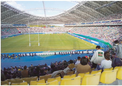
17,000人で埋まった観客席

ンに向けてのテストマッチ初戦が10月23日(土)、大分市の昭和電工ドーム大分で開催された。対戦相手はオーストラリア。オーストラリアは世界ランク3位の強豪チーム。日本の戦力を測るには格好の対戦相手だ。W杯以降、2年ぶりとなるこ