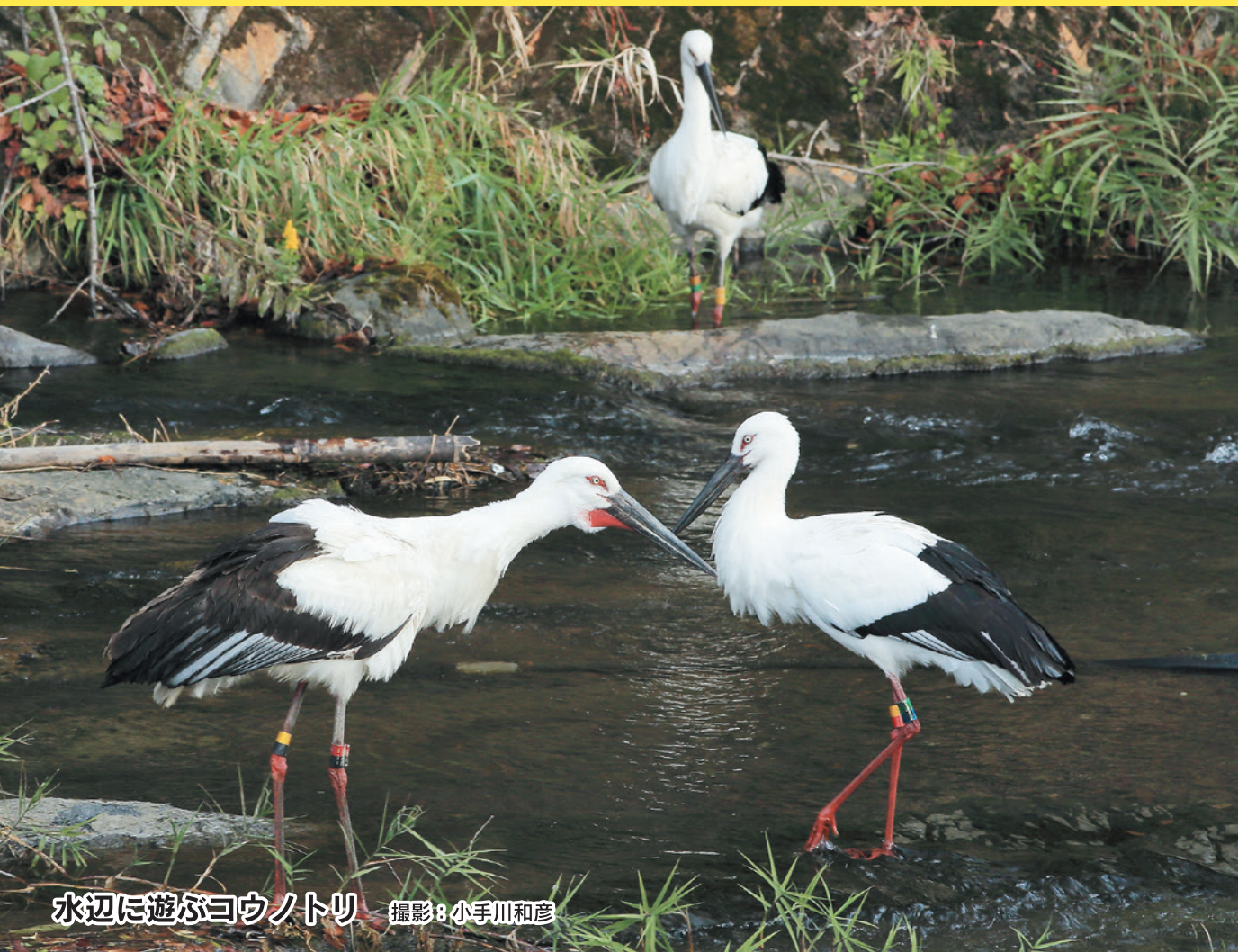
水辺に遊ぶヨウノトリ