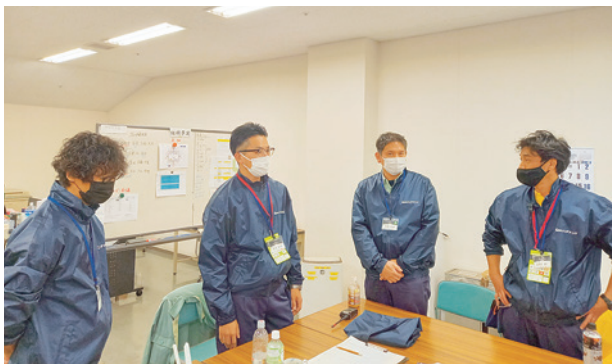
夜の仕事のミーティング

総責任者としての勤めが出来たかどうかよくわからないが、観客の皆さんたちが、無事に楽しく観戦できたので良かったと思っている。また、従業員さんたちから大変働きやすかったという声が聞かれたので何とか総責任者としての勤めを果たせたのかなとも思っている。大会を終えて、やってよかった、頑張った甲斐があったなど実感している。