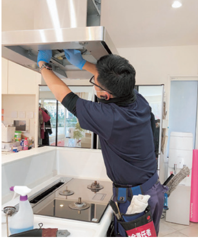
レンジフード清掃

いませんか。確かにプロユーズの洗剤は、良く落ちるかもしれませんが、取り扱いには知識と経験、注意が必要となる物が多いのです。その点、市販されている商品は誰