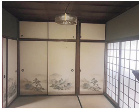
和室リフォーム前

S邸には、これまで80歳を超える母親が一人で暮らしていた。年若いではいるものの、身体は比較的元気だし、一人暮らしの方が気を使わなくていいと言うので、言うに任せていた。とこ