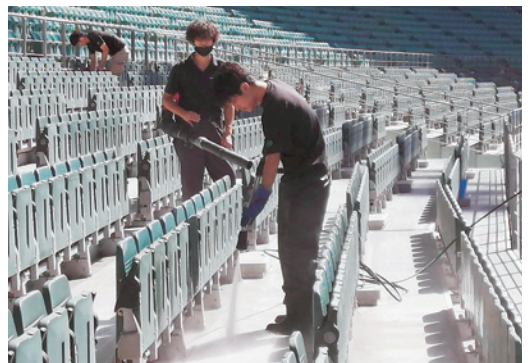
可動席は高圧洗浄機で

可動席を入れて約40000人が収容できるドームである。コロナ対策で観客は半数に制限しているものの、観客席の全てを清掃しなければならぬ。しかもほとんどが手作業である。片方にスプレー除菌洗剤、もう一方には雑巾を持ち、一つひとつ丁寧に拭き上げていく。可動席は、W杯以来なので高圧洗浄