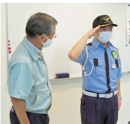
《津島リスク管理室室長が講師に》