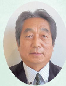
株式会社 大分空港メンテナンス 代表取締役