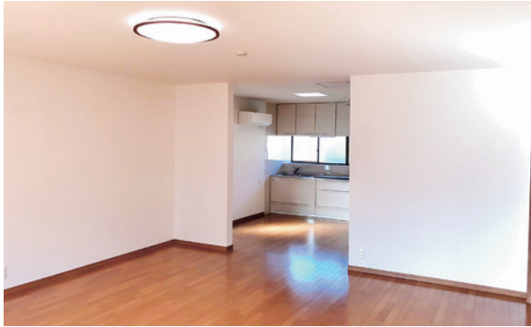
リビング～キッチン