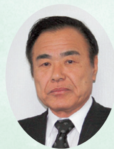
「さざんか会」会長 株式会社環境整備産業 取締役会長