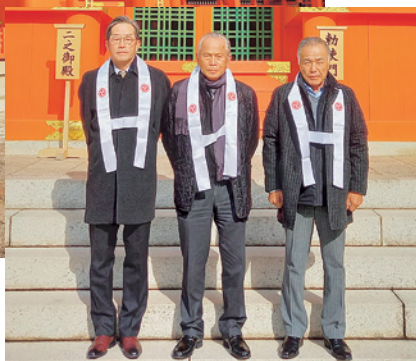
左から森社長、谷口会長、首藤会長