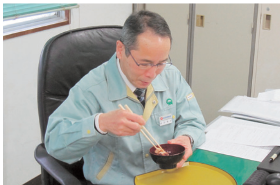
ぜんざい～ 久しぶりい～!!