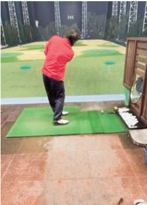
こんなショットはどうか