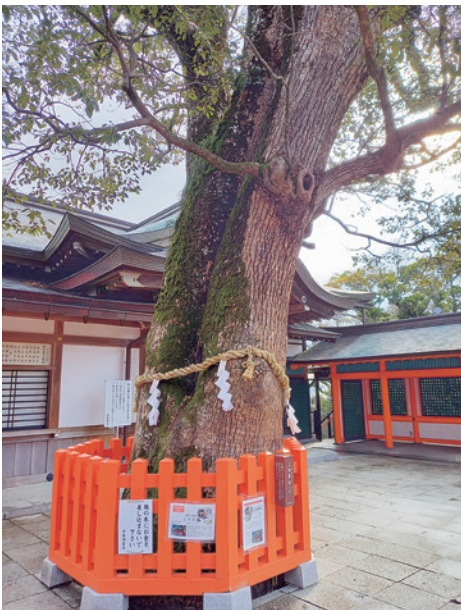
霊験あらたかな パワースポット

宇佐神宮に限らずどの神社でも見受けられることだが、様々な形で私たちの願い事をか纳えていただく手立てが講じられている。