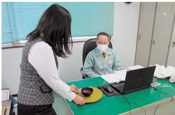
どうぞ、お召しあがりを

鏡開きを創業以来の伝統行事として続けることは並々のことではないだろう。しかし、日本の古き良き伝統を守り、物を無駄にしない心、人を思いやる心は会社のさらなる発展にもつながるのではなからうか。来年も是非続けてもらいたい行事である。