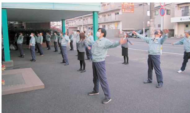
寒さに負けず元気よく

1月4日(火)の仕事始めの日も午前7時30分からラジオ体操の曲が流れ始めた。寒風が吹き抜ける玄関前には本社社員が勢揃い。音楽に合わせて一斉に体を動かし始めた。