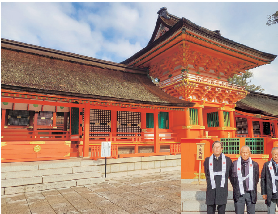
八幡社の総本宮に相応しい荘厳な造り