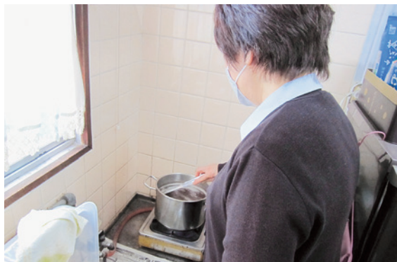
う～ん！ これくらいでいいかな