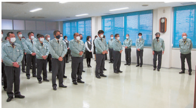
今日からまた気持ちを切り替えて

ラジオ体操が終わると、その流れで本社会議室に集合。午前8時より仕事始め式が行われた。