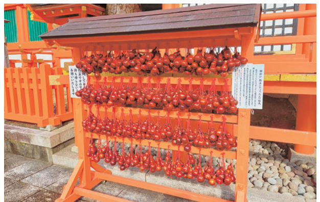
がんかけひょうたん