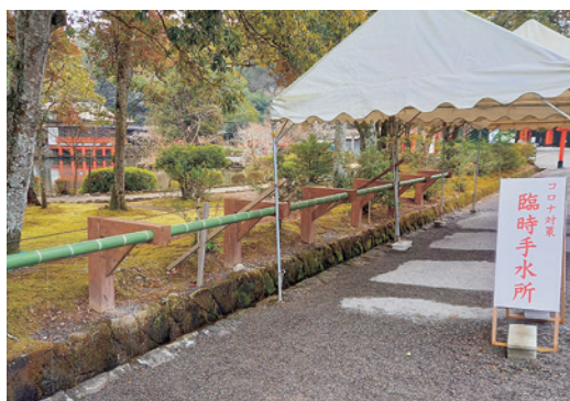
コロナ感染防止の手水所

シーンと静まり返った境内は人影もまばら。言葉少なに歩を進めると、玉砂利を踏みしめる音だけがこだましてくる。