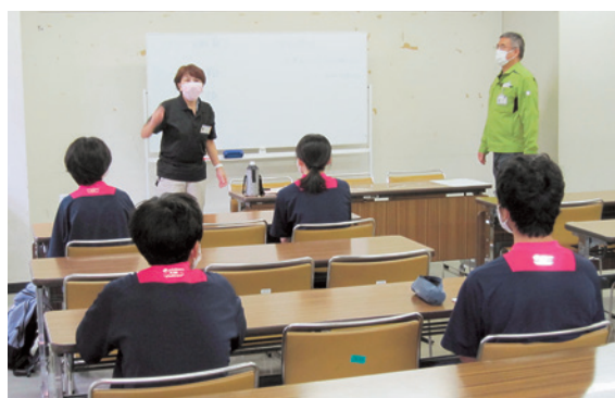
「効率よく」を心がけて

日（木）までの3日間、大分県立さくらの杜支援学校生徒が（株）メンテナンスの協力の下清掃体験学習を受講した。当社が支援学校の体験学習を受け入れるのは、今年になって3回目になる。