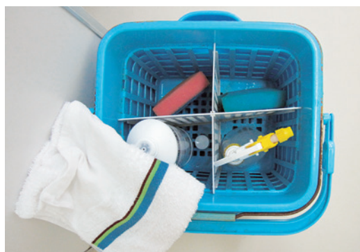
使った道具は元の場所に

「効率よく」と簡単に言うものの、実際の作業を間近で見ると、効率を追求するためには、高度な技術、体力、仕事に対する姿勢等を併せ持つことが必要なようだ。初めて本格的な掃除の仕方を体験する生徒たちに