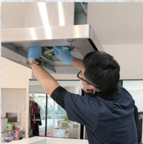
レンジフード清掃