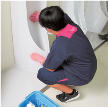
これでいいですか。