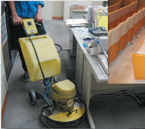
カーペット清掃中