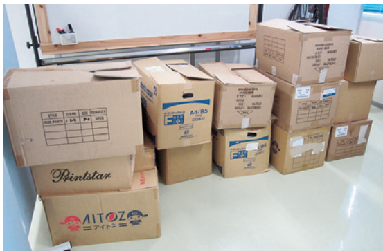
返ってきた制服の山

感を買いかねない。これでは、これまで50年以上かけて営々と築いてきた物の全てが、この一瞬で地におちてしまうのではなからうか。だから、古着として安易に再利用できないのである。