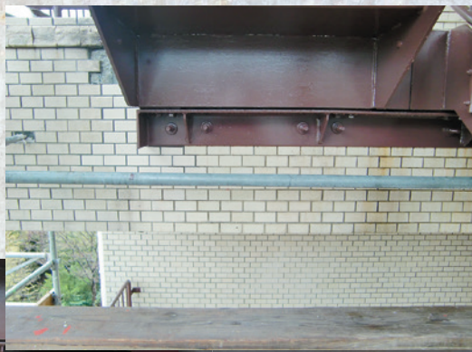
外壁タイル作業前

皆さん毎日の業務お疲れ様です。今年も早いもので10月を過ぎ残り2ヶ月余りとなりました。さて、当社は例年11月下旬から12月末まで、年末の特別清掃の依頼を多数頂きます。特別清掃とは、具体的に床洗浄・ワックス・カーペット洗浄・ガラス・網戸・トイレ・空調フィルター・換気扇清掃、又住宅清掃ならこれらの業務プラス風呂場・台所清掃等です。