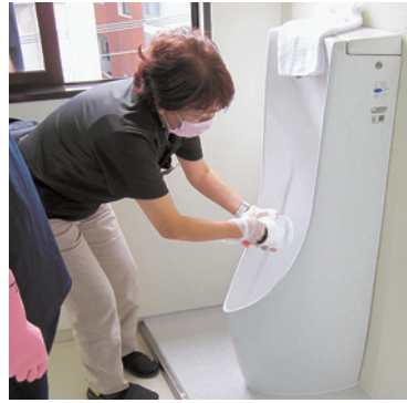
ここの汚れはこの道具で