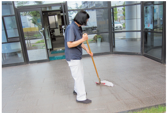
「いつ来ても、いつ見ても綺麗に」