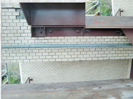
外壁タイル作業後