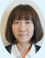
都 愛 係長

今年も働けることに感謝し、体調管理に気を付け、アイエットも頑張ります。身のまわりの整理整頓もしていこうと思います。