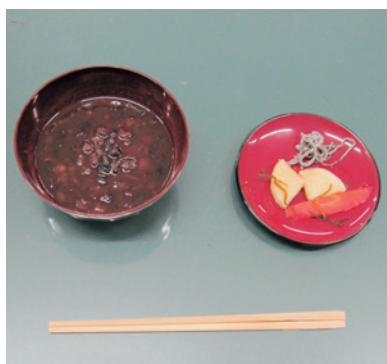
皆さんにふるまわれたぜんざいセット