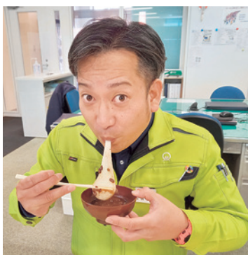
う～ん、これは最高だ！

この甘さではと思いい、箸休めを作ることにした。冷蔵庫には大根、ニンジンが鎮座していた。さっそく、みりんと醤油に漬けた即席の漬物を作ることにした。この2つに塩昆布を加えて3点セットの箸休めが出来上がった。さて、皆さん方の感想