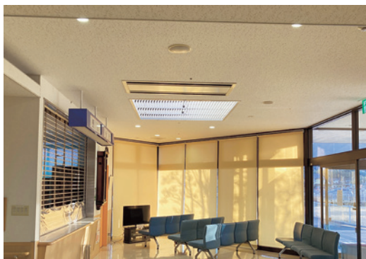
張り替え工事完了

て、工事は診療の無い土日の2日間に限って行った。しかし、土曜日であつても入院患者がおられるので、その親族や病院関係者の出入りはある。工事を進めるにあたっては、それらの方々に迷惑の掛からないよう細心注意を払った。また、天井ボードを剥ぐにあたっては、火災報知機やスプリンクラーが連動しているので、前もって消防署と連携したり防災士の資格を持つ当社の社員の協力を