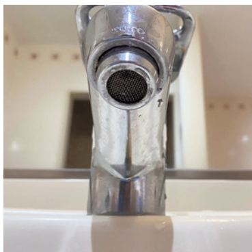
フィルターの取り付け部