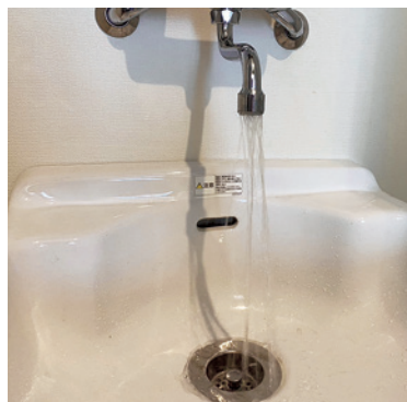
ゴミのつまりで水割れした水流