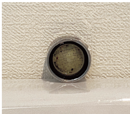
ゴミのつまつたフィルター