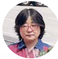
(株)大分空港 メンテナンス 清掃課

入社したての頃は私に勤まるかなと心配でしたが良い現場と人間関係に恵まれたおかげであったという間に過ぎた10年でした。これからも元気な限り勤め働きたいと思えます。