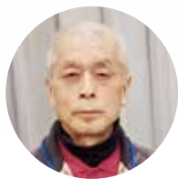
イオンモール 筑紫野

職場の皆さんに支えられ、助けられて楽しく勤めることが出来ました。体調には気を付けて、報恩感謝を忘れずに、仕事に頑張りたいと思います。これからも、どうぞよろしく願います。