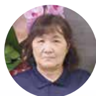
ルネックス 高松店

色々な事がありました。まわりの皆様のお陰で、何とかここまでやれたのかなと実感しています。今後とも、よろしく願います。