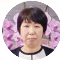
ルネサンス おおいた

務められたのも、会社の上司、先輩方、仲間を支えていただいたお蔭です。感謝申し上げます。 今後、自身の健康に気をつけ、怪我の無いよう努めてまいります。