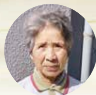
イオンモール 三光

あと、何年仕事が出来るかかわりませんが、少しでも長く続けられるよう頑張りますので、ご指導よろしく願います。