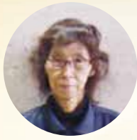
大分中央通り ビル

当初より気を付けていることは、ホテルという非日常の空間の中で、いかに快適に過ごしていたかどうか、お客様の気持ちになって考えることです。それは、これからも変わらず元気の続く限り頑張っに行きたいと思っています。 10年表彰していただき、ありがとうございました。