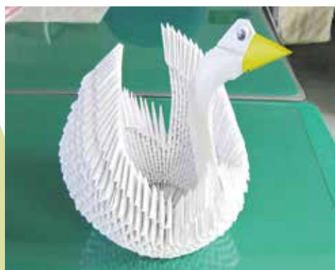
635ピースを積み重ねて完成

当社で働くようになって23年になる。この間、いろいろあったが、今は仲間にも恵まれ、助けられたり助けられたりの毎日である。このことは、毎日の仕事の励みになるし、働いている方が身体のためにもいいので、毎日楽しく仕事をしている。これからもいろいろなことに挑戦をしたい。一生、挑戦のつもりだと話を結ばれた。