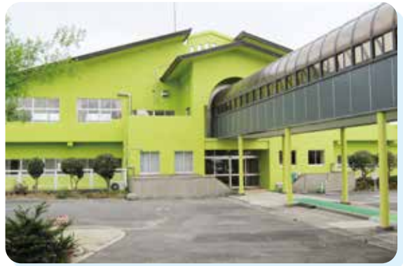
青少年の家の一景

青少年の家は、学校や各種団体、家族、企業の研修、体験活動の場として利用できる施設で、美しい海と森と空に囲まれた絶好の活動拠点である。 ここには、300名収容可能な宿泊施設のほか、170名収容のキャンプ場、人工海浜の海水浴場があり、毎年県内各地の学校・子ども会等が香々地の素晴らしい自然の中で貴重な体験活動を行っている。