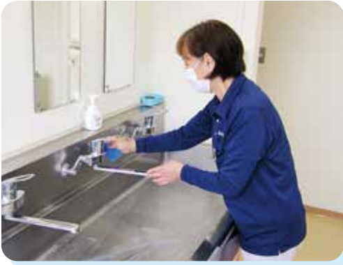
心を込めてピカピカに

時ぐらい。更に、床の定期清掃でポリッシュャーを使った洗浄・ワックスがけもある。もちろん、2人で仕上げる。