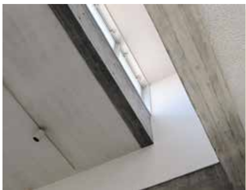
排煙口のある高所の窓

今回の現場は、アートプラザだ。この施設は、大分県が輩出した世界的な建築家・磯崎新氏が設計したことで有名な建造物である。