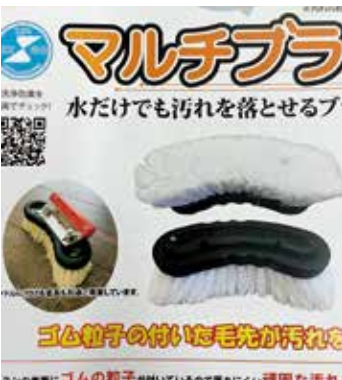
(株) smartのマルチブラシ