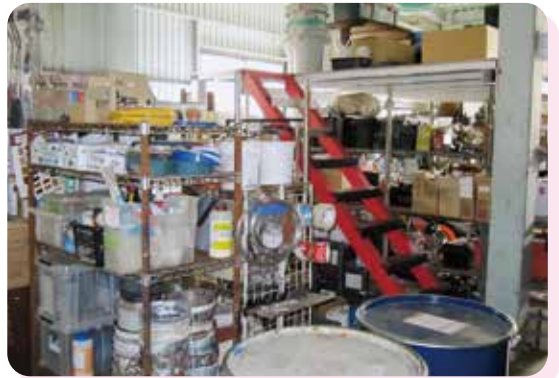
整理整頓の行き届いた倉庫内

近隣住民に対しても同じ事であ る。いくら高い技術を提供して も、イメージが悪ければ、些細な ことでもトラブルに発展する場 合があり、お互いが気まずい思 いをしてしまうことになる。