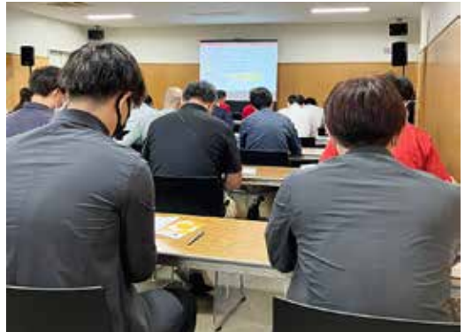
セミナー受講風景