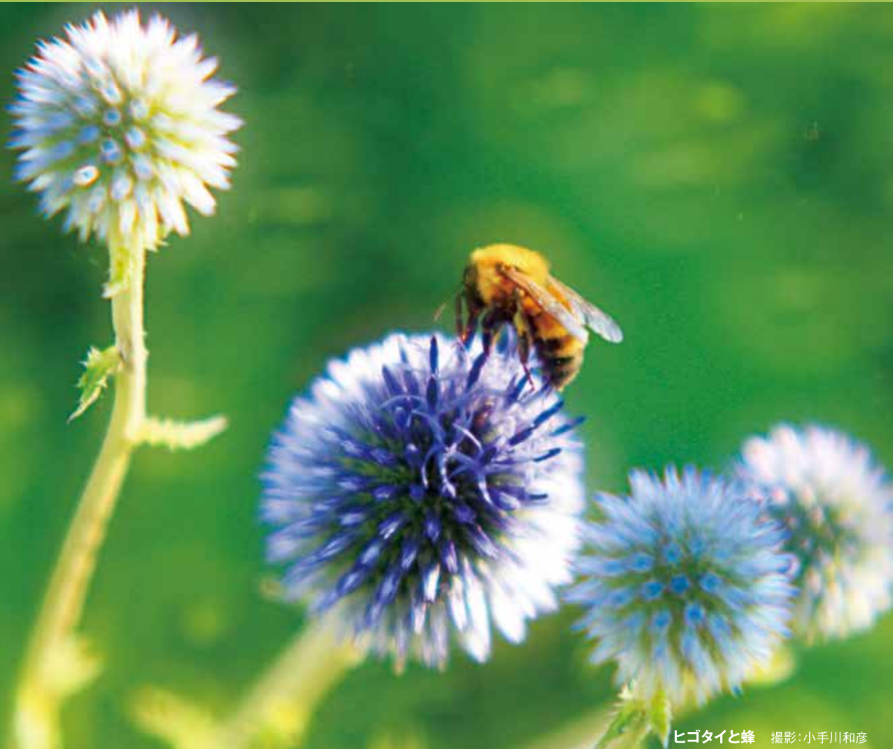
ヒゴタイと蜂