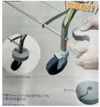
(株) 山崎産業コンドルダストカート用 スポンジバンパー