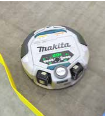
最新掃除ロボット