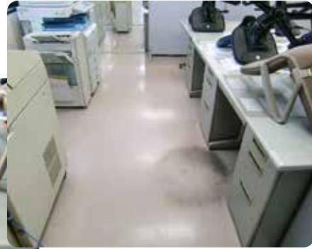
事務所床洗浄ワックス作業前

皆さん、毎日の業務お疲れ様です。今年も早いもので10月を過ぎ残り2ヶ月余りとなりました。さて、当社は例年11月下旬から12月末まで、年末の特別清掃の依頼を多数頂きます。特別清掃とは、具体的に床洗浄ワックス、カーペット洗浄・ガラス・網戸・トイレ・空調フィルター・換気扇清掃、又住宅清掃ならこれらの業務プラス風呂場・台所清掃等です。