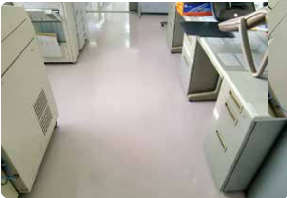
事務所床洗浄ワックス作業後