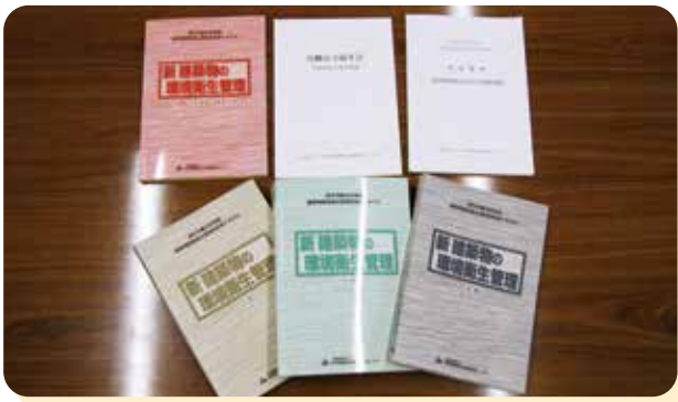
分厚い受講テキスト