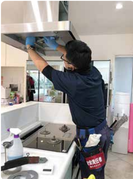
レンジフード清掃