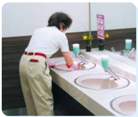
使う人の気持ちになって

械)を使った床清掃が行われていた。床清掃は毎日行うのだが、その手順は次の通りである。