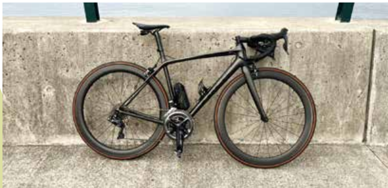
手作りのロードバイク

子どもの頃は、朝から晩まで遊びまわっていた記憶しかない。家には、ご飯を食べる時か寝る時にしか帰らなかつたようだ。両親が共働きだったせいもある