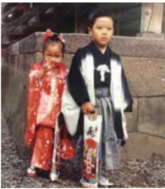
羽織袴姿も凛々しく

スポーツが得意で、小学校の頃はバスケットボールと少年野球にのめり込んでいた。小5の頃は痩せてはいたが、身長が160cm位あったことから、バレーボールも始めるようになった。中学・高校はバレーボールに打ち込んだ。ただ、中学校のバレー部は弱小チームだったので、はかばかし