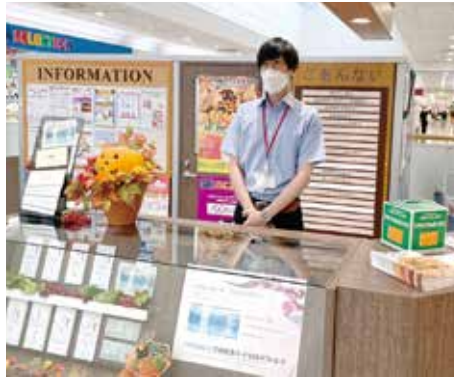
お客様を優しく見つめながら

インフォメーション担当の仕事内容は、基本的には「お客様の困りを解決して差し上げる」にある。困りの多くは、商品の売り場を訊ねられることである。ただ、中に