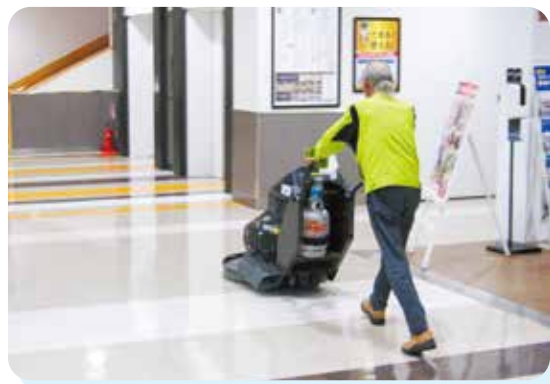
軽やかなフットワークで操作