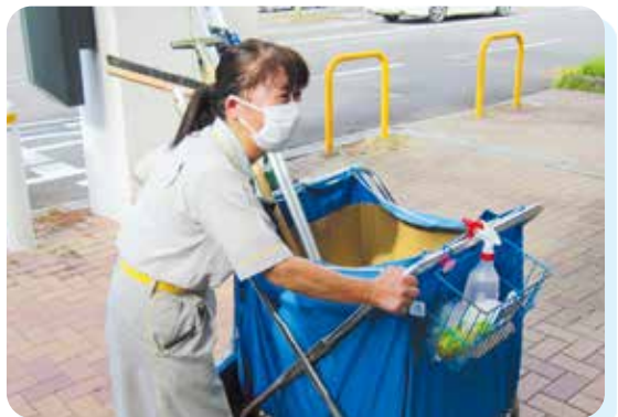
サーー 外まわりだ