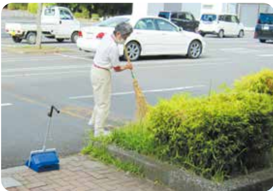
すみずみまで心を込めて