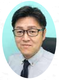
「さざんか会」会長 有限会社日本ビルサービス 代表取締役社長