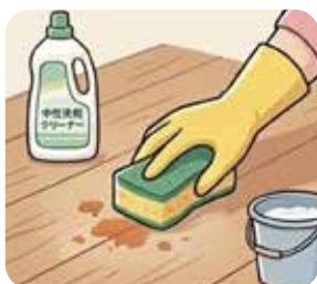
2.汚れを中性洗剤を付 けたスポンジでこする