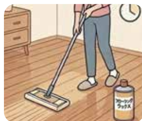
6.木目に沿ってワックスを塗る 7.しばらく乾かして完了