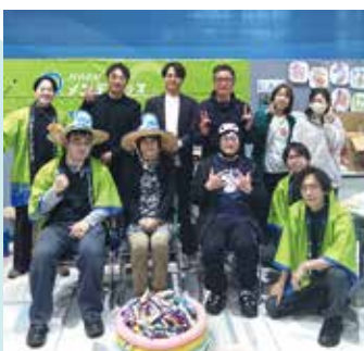
笠木会長も駆けつけ 皆で記念撮影