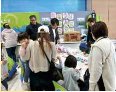
笠木社長も駆けつけてくれました