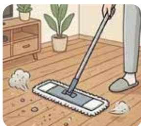
1.床のゴミ、ほこりを 除去