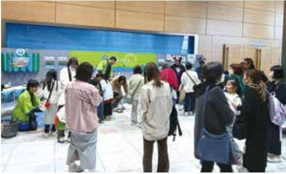
大盛り上がりのイベント会場

ビーコンプラザ開館30周年イベントとして、夏に開催された『サマーパーティー』に引き続き、3月22日(日)に『ファイナーレパーティー』が開催されました。(株)メンテナンスもイベントに参加し、ワークショップを出展してきました。30年間、多くの方々に親しまれてきたビーコンプラザ。その歩みの中で、当社も清掃や設備管理を通して、皆様が安心して過ごせる空間づくりに努めてまいりました。開館30周年という節目のイベントに参加できることを、心から光栄に思っています。