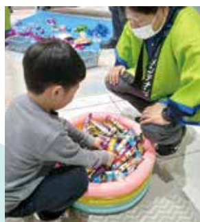
熊瀬商店から お菓子のプレゼント