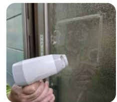
②ドライヤーで温める