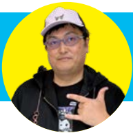
キットソンこと 北次長