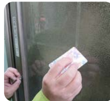
③プラスチックカードで擦る