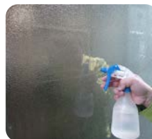
⑤アルコール液を吹きかける