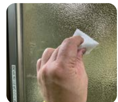
⑥メラミンスポンジで磨く